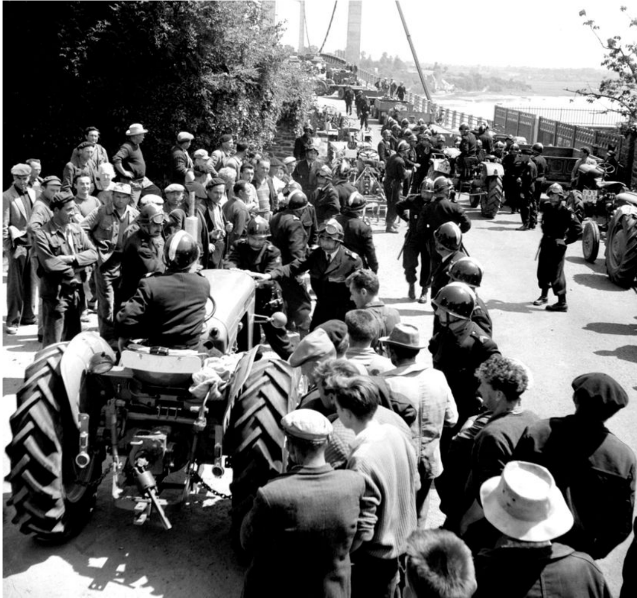
Des C.R.S. déplacent, le 22 juin 1961, les tracteurs de paysans mécontents qui bloquent le passage sur le pont suspendu de Port-Saint Hubert, enjambant l'estuaire de la Rance et permettant de joindre Dinard à Saint-Malo.